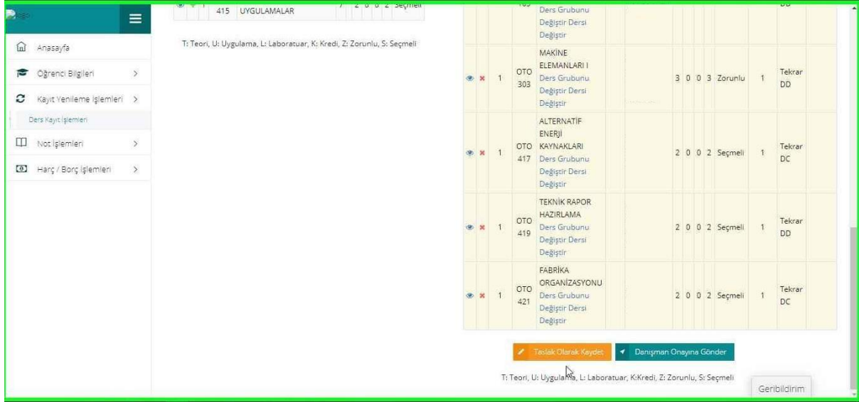
Resim-4: Kaydetme ekranı

4. Derslerinizi seçtikten ve Seçilen Dersleri ekledikten sonra “Seçilen Dersler” bölümüne geçerek derslerinizi son bir defa kontrol ederek aşağıda resimde gösterilen “Danışman Onayına Gönder” butonu vasıtasıyla derslerinizi danışmanınıza gönderebilirsiniz. Danışman onayına göndermeden önce “Taslak Olarak Kaydet” butonu ile seçimini yaptığınız dersleri kaydedebilir daha sonra tekrar düzenleyebilir ve seçilen dersleri kesinleştirdikten sonra danışman onayına gönderebilirsiniz.