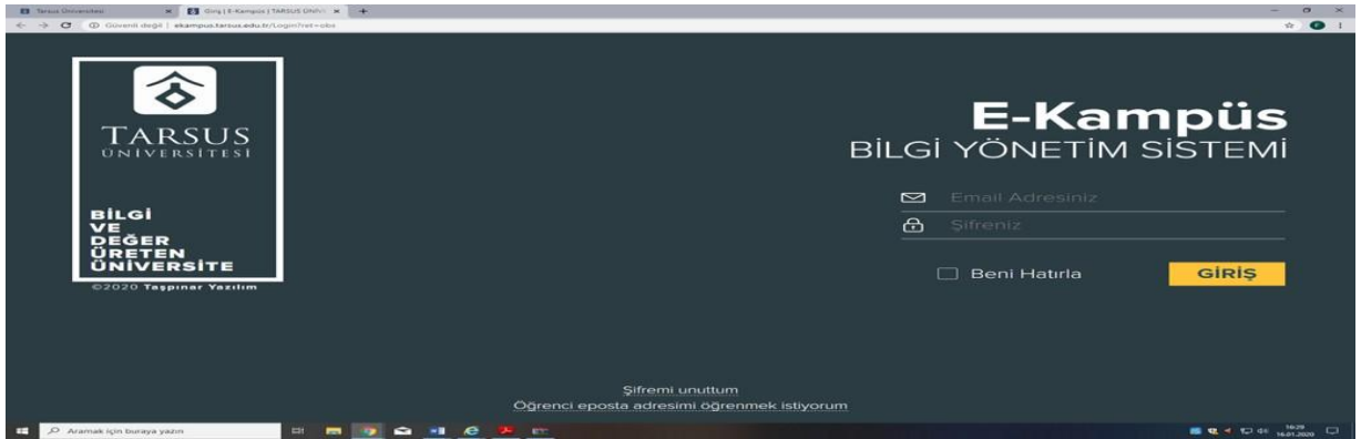
Resim 1- Kullanıcı Giriş Sayfası